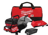
CORTADORA DE DISCO