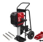
ROMPE PAVIMENTO MX